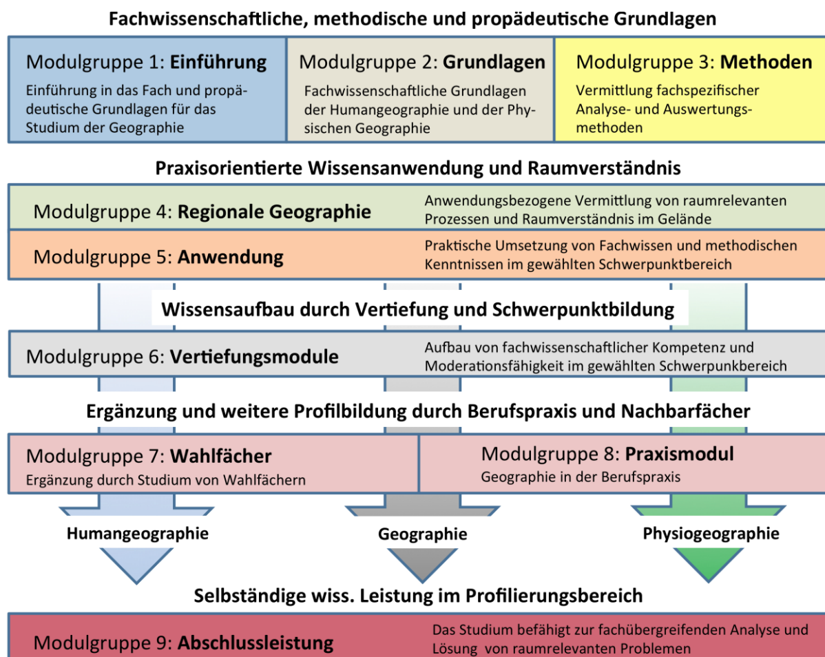
Abb. 1: Strukturdiagramm des Bachelor Geographie.

Ein Beginn ist zum Wintersemester empfohlen - bei einem Beginn im Sommersemester können Verzögerungen im Studium nicht ausgeschlossen werden.